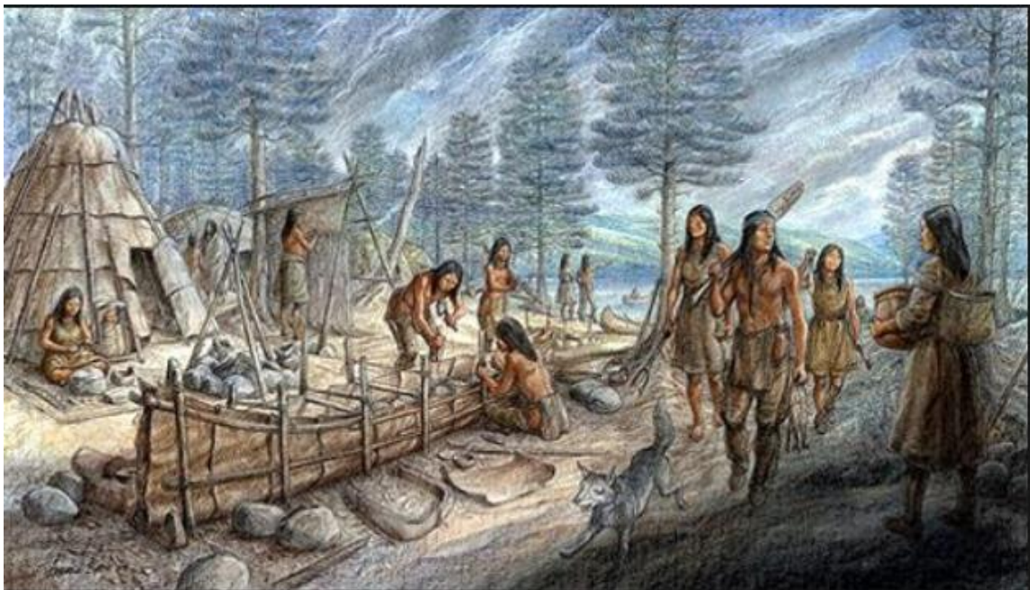
Campement indien au début de la colonie