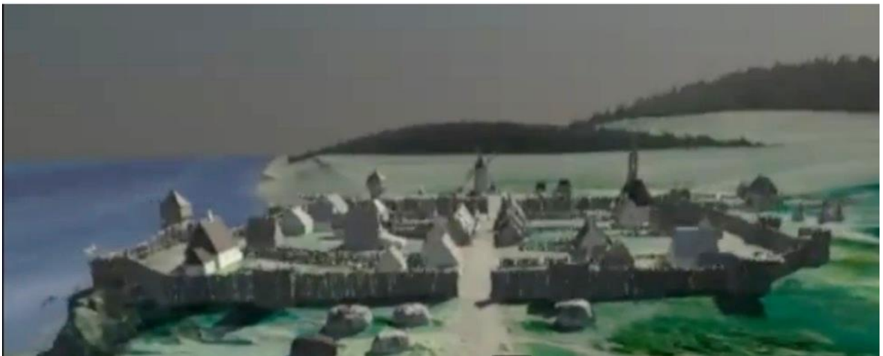
Représentation du bourg du Fort Ville-Marie