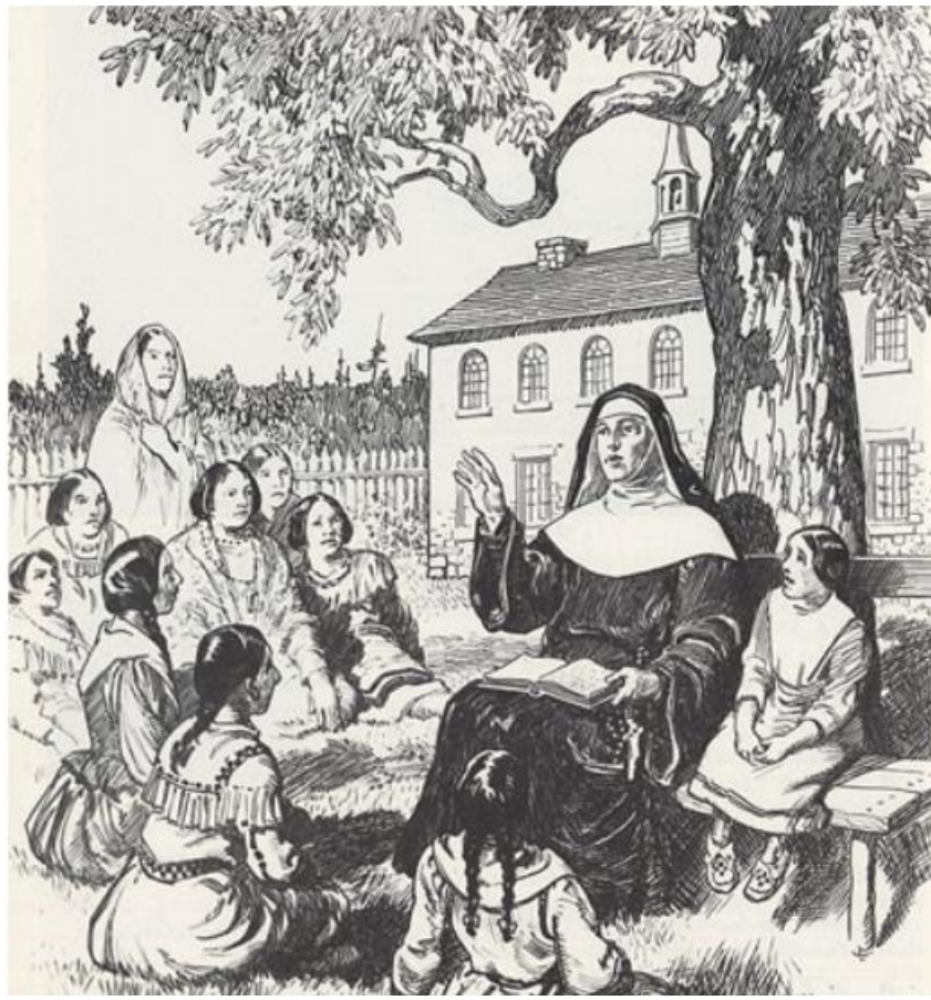
Enseignement des jeunes autochtones en 1669