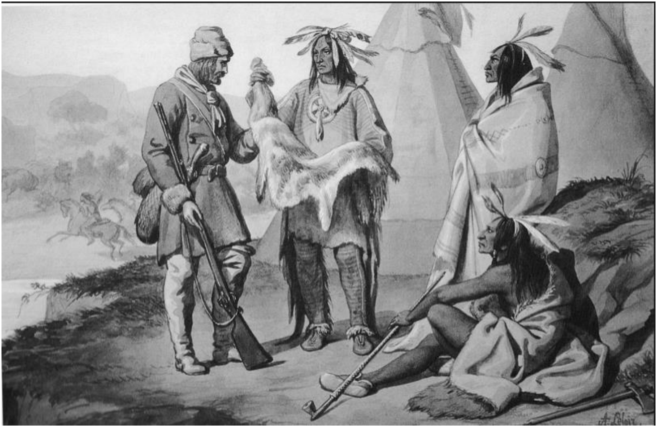
Traite de fourrures entre commerçants et indiens